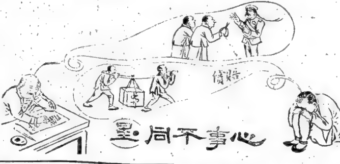
新五才子 (不許稱所有)